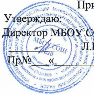
График заседаний аттестационной комиссии ГБПОУ КК ТТКР